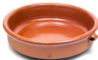
SGR-0120BR ¥1,700 φ 20XH5