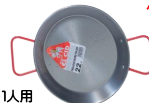
SEC-22 ¥1,450 φ 23