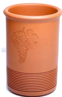
ワインクーラー SGR-2402BR ¥2,500 φ 12.5XH20