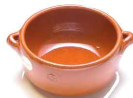
SGR-0713BR ¥1,500 深鍋型 φ 13XH6