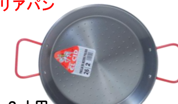
2人用 SEC-26 ¥1,650 φ 26