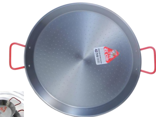
10人用 SEC-42 ¥3,600 φ 43