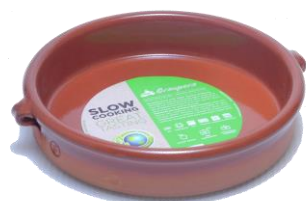
SGR-0117BR ¥1,300 φ 17XH3.5