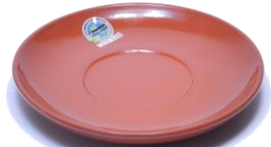
プレートM SGR-1218BR ¥1,600 φ 18