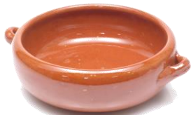
浅鍋型 SGR-0613BR ¥1,350 φ 13XH4.5