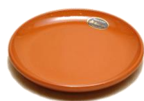
プレートS SGR-1214BR ¥1,100 φ 14