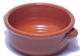
深鍋型 SGR-3013BR ¥1,350 φ 13XH5