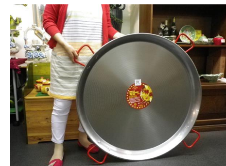
イベント・キャンプ φ 90cm ウエディング用 Big サイズ 50人用