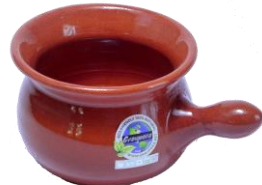
ココアポット SGR-1804BR ¥1,900 L14XH7.5