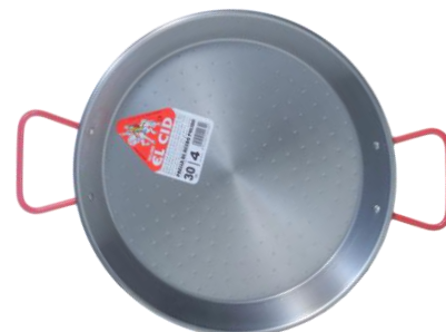
4人用 SEC-30 ¥1,850 φ 30