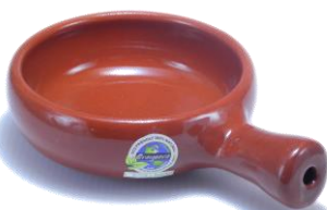
浅鍋型 SGR-0813BR ¥1,800 φ 13XH4.5