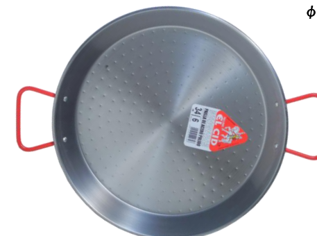
6人用 SEC-34 ¥2,200 φ 34