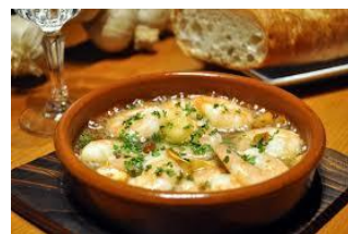
深鍋型 SGR-0920BR ¥3,500 φ 20XH8