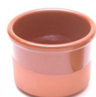
カスタードポット SGR-1601BR ¥700 φ 8.5XH6