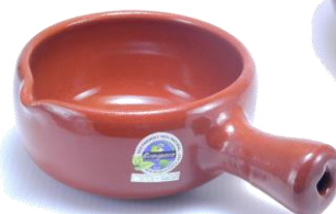
SGR-0913BR ¥2,000 φ 13XH6