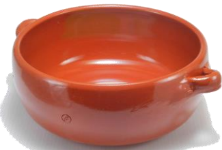
SGR-0720BR ¥2,800 φ 20XH8