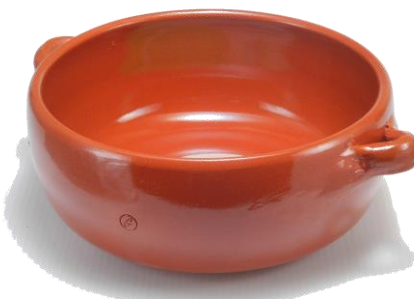
深鍋型 SGR-0720BR ¥2,900 φ 20XH8