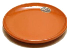
プレートS SGR-1214BR ¥1,100 φ 14