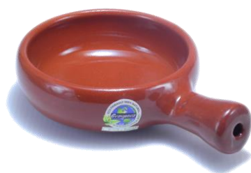
浅鍋型 SGR-0813BR ¥1,900 φ 13XH4.5