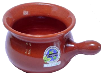
ココアポット SGR-1804BR ¥1,900 L14XH7.5