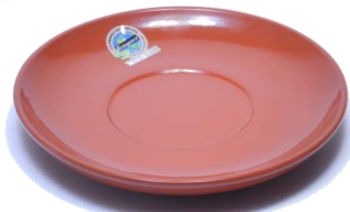
プレートM SGR-1218BR ¥1,600 φ 18