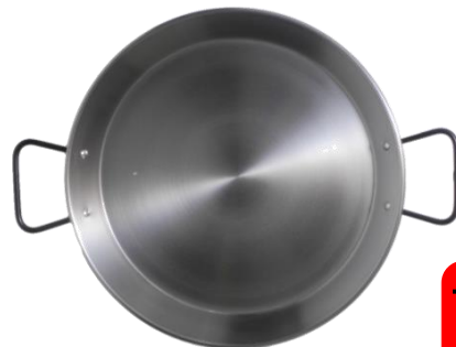
SEC -30-IH ¥4,400