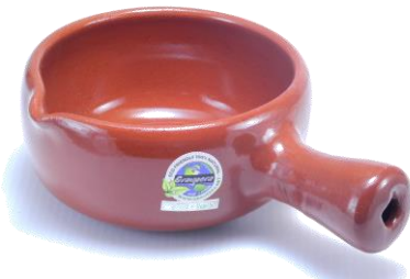
深鍋型 SGR-0913BR ¥2,100 φ 13XH6