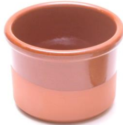
カスタードポット SGR-1601BR ¥700 φ 8.5XH6